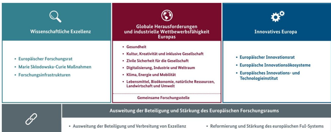
Abbildung 1: Struktureller Aufbau von Horizont Europa

Der Themenbereich Cybersicherheit ist ein Teilaspekt des gesamten Programms und ist vorwiegend im Cluster 3 „Zivile Sicherheit für die Gesellschaft“ vertreten.